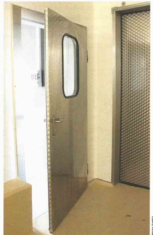
Robuste, leicht zu reinigende Betriebsraum-Drehtüren aus Edelstahl rostfrei präsentiert Mohn auf der IFFA.

In der Lebensmittelverarbeitung werden hohe Anforderungen an die Betriebsmittel gestellt. Das gilt auch für die Türen und Schiebetore. Diese müssen zuverlässig