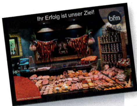
Bitte beachten Sie die Beilage der Firma bfm Ladenbau.